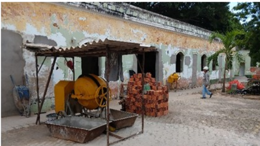
Obra no Anexo II

A reforma do anexo II da SFA-MA se arrasta lentamente. É impressionante o ritmo das obras. Chega a ser cômico. O prédio principal continua com os mesmos problemas, pois nada foi feito para resolver as questões estruturais onde está lotado a maior parte dos funcionários da área técnica, além da Secretaria de Pesca, Serviço Financeiro, Protocolo, Almoxarifado e CPD. Mesmo o anexo I, que foi recentemente reformado e que abriga o Gabinete, e parte dos Serviços Administrativos, já conta com vários problemas, como goteiras, infiltrações e rachaduras. A Gestão está gastando R$ 500.000,00 nesta obra, que já teve dois embargos do DPHP-MA e que não parece querer terminar. Do lado de fora, o estacionamento parece concluído, mas está embargado pelo DPHP-MA, interditado a quase oito meses, faz com que carros de usuários e funcionários tenham que estacionar sobre calçadas e até sobre a praça, ficando sujeitos a multas e guincho, como já aconteceu algumas vezes. A novidade no projeto é a inclusão de um puxadinho próximo a saída dos carros, na lateral do prédio, que muito provavelmente está irregular. O contrato foi prorrogado e deverá receber mais R$ 247.595,72 para a conclusão, que agora ficou para 05 de março de 2019. O MPT e o DPHP estão de olho!